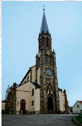
Eglise Saint-Ulrich Morschwiller-le-Bas