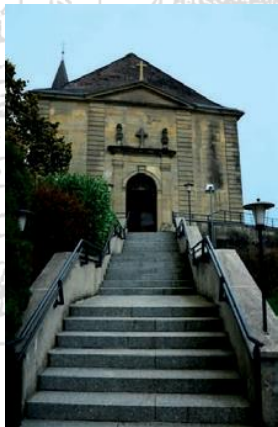
Eglise Saint-Gangolphe Galfingue