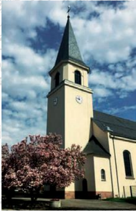
Eglise Saint-Romain Reiningue