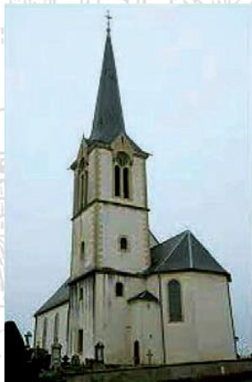
Eglise Saint-Projet et Saint-Amarin Heimsbrunn