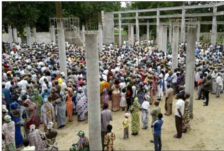
Messe sur le chantier de la cathédrale

En février dernier dans la localité de Mémé, deux kamikazes ont entraîné au moins vingt personnes dans la mort en se faisant exploser sur le marché et en ont blessé des douzaines. Par contre, la prière a sauvé d'autres personnes. « À l'heure de l'attentat, beaucoup de femmes travaillant sur le marché et d'autres personnes du village venaient juste d'aller à l'église pour participer à la prière du Chemin de croix. Elles disent : "Nous sommes encore en vie parce que nous étions dans l'église. Sans le chemin de croix, nous serions mortes." »