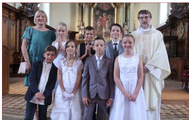
Quelques images des Premières Communions 2018