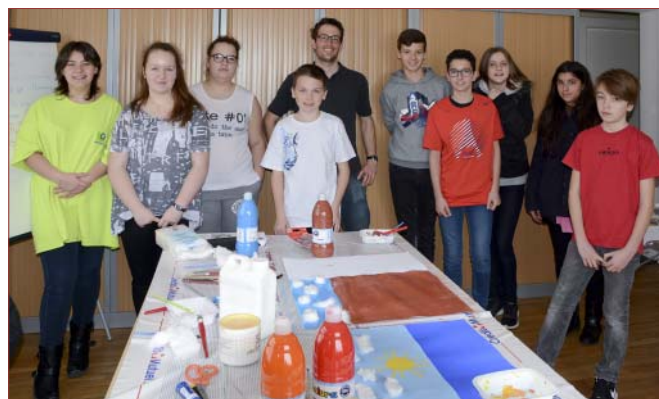
Au cours du caté avant la Profession de Foi (2017)

Nous espérons que l'exemple des quelques grands jeunes qui nous ont accompagné et qui ont animé les temps conviviaux et la veillée, leur donnera l'envie de poursuivre leur chemin sur cette connaissance de Dieu, de prendre leur place dans notre Communauté de Paroisses là où ils en sont. La disponibilité des tuteurs, toutes ces personnes de notre communauté qui ont su prendre du temps avec bienveillance pour rencontrer individuellement les jeunes de la confirmation, les a beaucoup touchés et a contribué à leur croissance dans la foi.