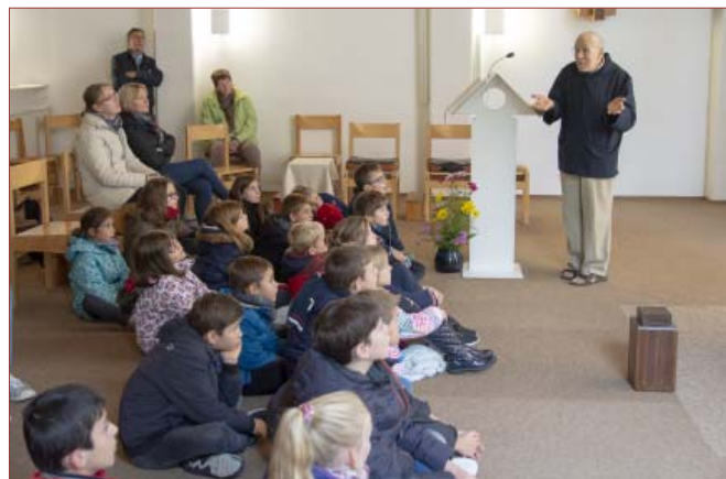
Visite et temps de prière au Prieuré Saint Benoît de Chauveroches

Ces célébrations ont lieu régulièrement à l'église St-Ulrich de Morschwiller-le-Bas, particulièrement aux moments forts de l'année liturgique : entrée en Avent, Noël, Epiphanie, entrée en Carême, Semaine Sainte (une messe est destinée aux enfants le Jeudi Saint).