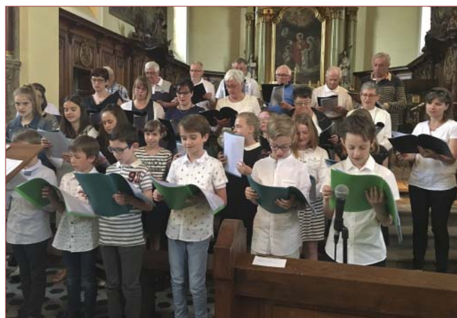
Recueillement en musique et en chansons à Reiningue