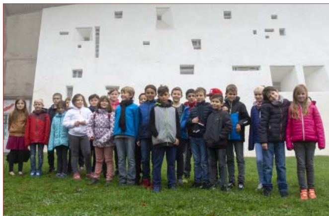
Pèlerinage des enfants à Notre-Dame du Haut à Ronchamp

Notre Communauté de Paroisses St-Benoît près d'Élenberg a vécu de belles fêtes à l'occasion des célébrations des Premières Communions de nos enfants en ces mois de mai et juin. Leur itinéraire catéchétique de deux ans a été jalonné d'activités et d'événements qui ont permis à ces enfants d'avancer sur le chemin à la rencontre des autres et de Jésus.